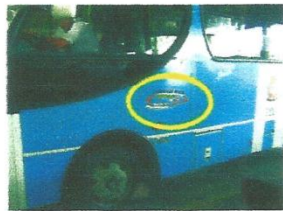
Identificação da operadora