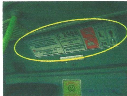
Adesivo da caixa de vista