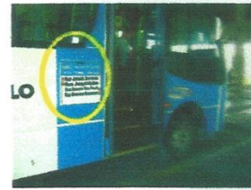
Placa de itinerário lateral