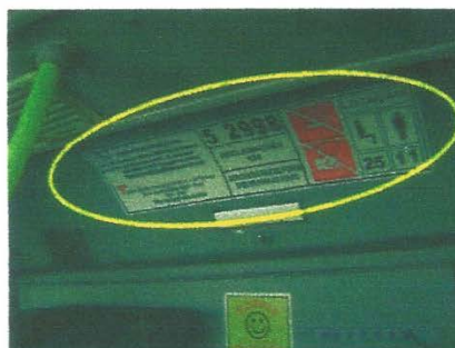
Adesivo da caixa de vista