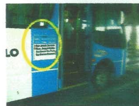
Placa de itinerário lateral