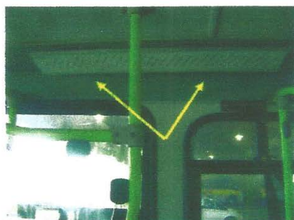
Placa de itinerário interno