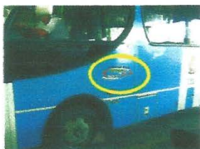
Identificação da operadora