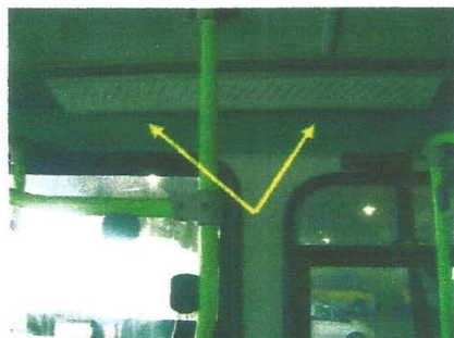
Placa de itinerário interno