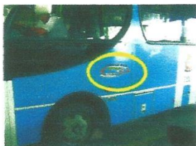
Identificação da operadora