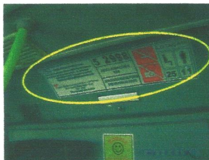
Adesivo da caixa de vista