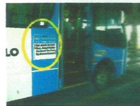
Placa de itinerário lateral