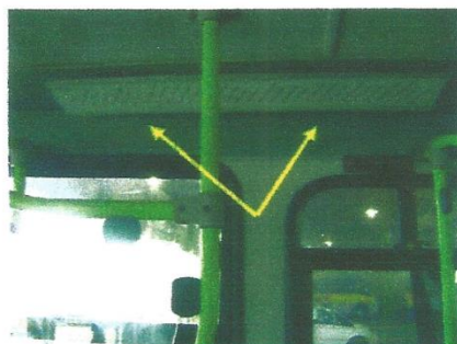
Placa de itinerário interno